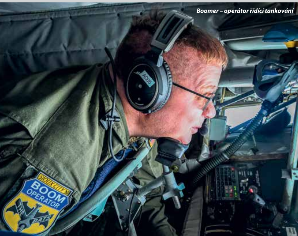
Boomer – operátor řídicí tankování

• Cvičení je skvělou příležitostí ke sdílení profesních zkušeností a dovedností mezi jednotlivými odbornostmi.