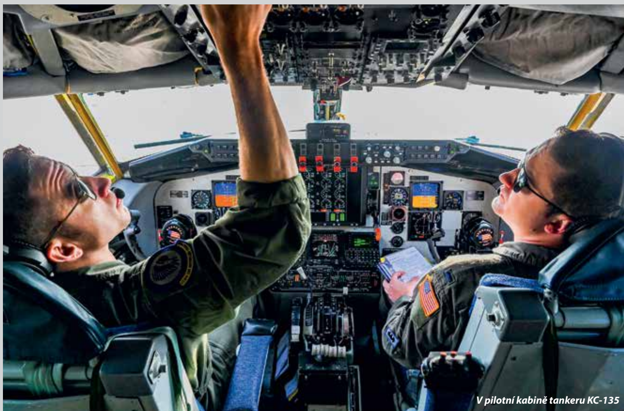
V pilotní kabině tankeru KC-135

Čtrnáct týmů JTAC (Joint Terminal Attack Controller) z devíti členských států NATO v průběhu cvičení provedlo celkem 889 navedení letadel na cíl. Posádky více než 20 letounů a vrtulníků strávily ve vzdušném prostoru České republiky v součtu 450 hodin. „S průběhem cvičení i jeho výsledky jsem spokojen, 51 leteckých návodčích dostalo možnost udržet si či získat platnou kvalifikaci v souladu s aliančními standardy. Jsem nadšen