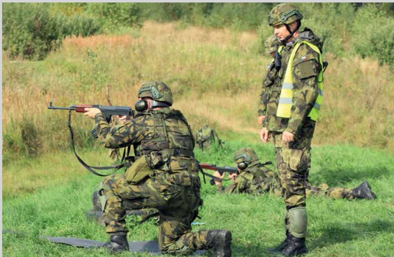
Střelby jsou alfou a omegou při každém výcviku.

Text: Redakce A reportu a pplk. Miroslava Štenclová