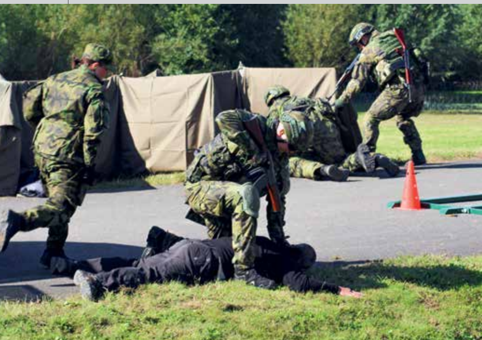
Ve scénáři byl i útok teroristů.

Na celorepublikový výcvik teritoriálních sil Hradba 2021 navázalo cvičení Safeguard,